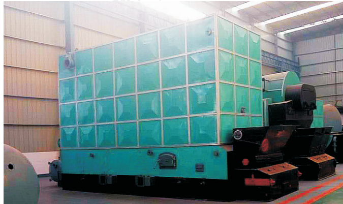
2014.11-2.35吨 YLW-1600MA 江西萍乡众大新材料有限责任公司