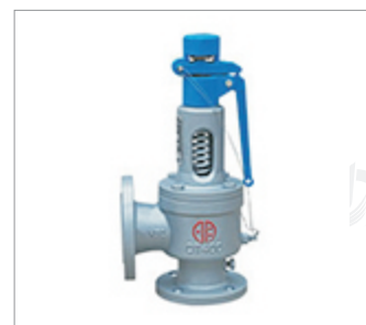
郑州明宇球墨铸铁 弹簧全启式安全阀