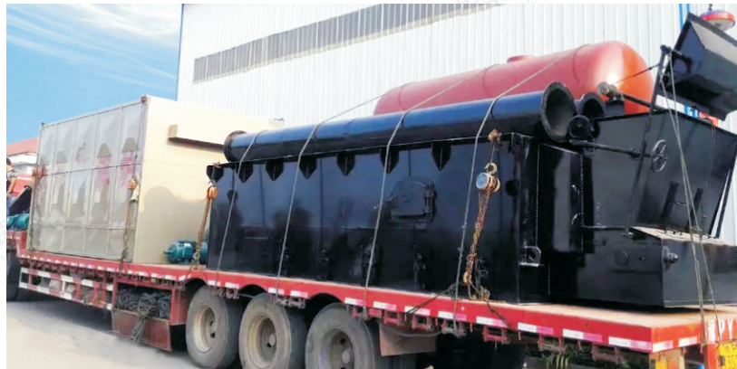
2014.2-6吨 YLW-4200MA 河南焦作多氟多化工股份有限公司