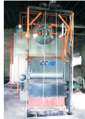
2016.5-2.75吨 YLW-1900MA 开封杞县东旺光伏科技有限公司