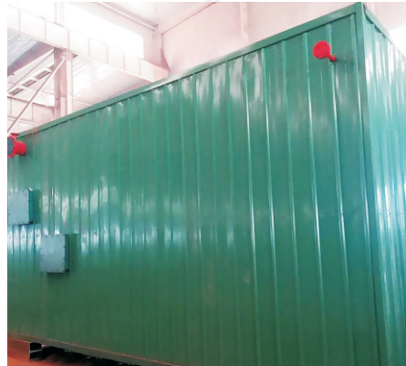
2016.1-2吨 YLW-1400MA 浙江金华友晨胶粘材料有限公司