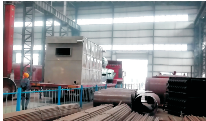
2014.5-5吨 YLW-3500MA 山东红日阿康化工股份有限公司